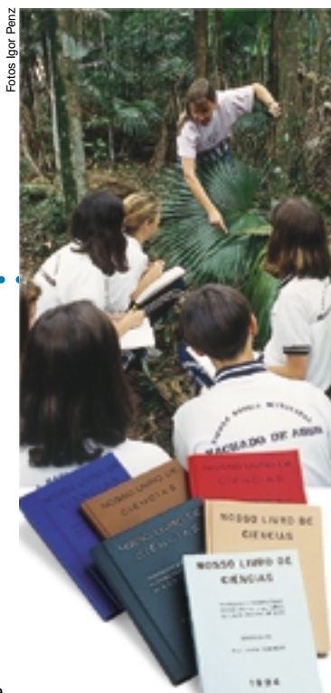
Visitas à mata da escola geram relatos dos alunos: no fim do ano, os textos são reunidos na obra Nosso Livro de Ciências

ser impresso. "Os erros de ortografia e de pontuação são corrigidos pela professora de Português, mas a essência dos textos não muda em nada", diz Schroeder. Ele mesmo datilografa ou digita em computador os relatos selecionados. Depois de organizada, a edição é xerocada para os demais alunos. "Quando vêem seus textos e desenhos impressos, eles se dão conta da própria originalidade", constata o professor.