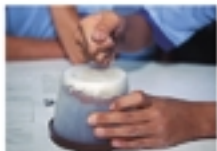
Tampe o pote e deixe a argila secar por três dias. Vire-o ao contrário e bata de leve no fundo para desgrudar

Ao separar as duas bolachas, encontra-se o modelo de um fóssil. Ele não enganaria um especialista, mas dá uma excelente idéia de como funciona o processo natural.