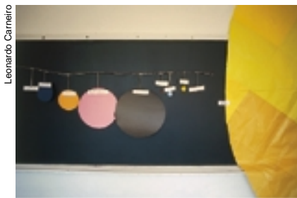
Representação do Sistema Solar: cuidado com a proporção dos planetas e do Sol

determinam períodos de calor ou frio em diferentes regiões do planeta. Movimento das marés, eclipses e outros fenômenos também podem fazer parte do cardápio para o ensino de Astronomia no Ensino Fundamental. Além de Ciências, outras matérias são favorecidas pelo estudo dos astros. Em