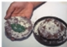
Separando as duas bolachas de argila, você vê os fósseis da folha. Na primeira, está o molde fóssil