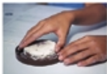
Abra com cuidado para não quebrar o sanduíche de argila que caiu na tampa do potinho. O fóssil já está pronto