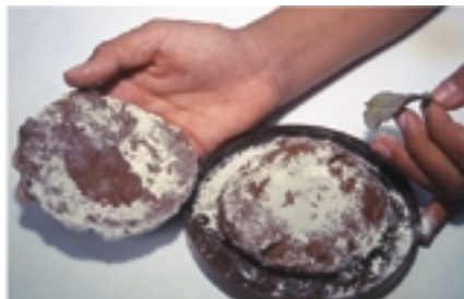
Na segunda bolacha, que ficou no fundo do recipiente, encontra-se a marca fóssil, o contramolde da folha