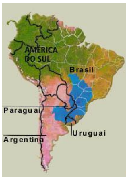
Localização do Aqüífero Guarani

As águas subterrâneas representam 98% de toda a água doce disponível no mundo, e nisso a natureza também privilegiou o Brasil. Na região centro-leste da América do Sul está situado aquele que é provavelmente o maior manancial transfronteiriço de água doce subterrânea do mundo : o Aqüífero Guarani, que possui mais líquido que todos os rios do mundo juntos.